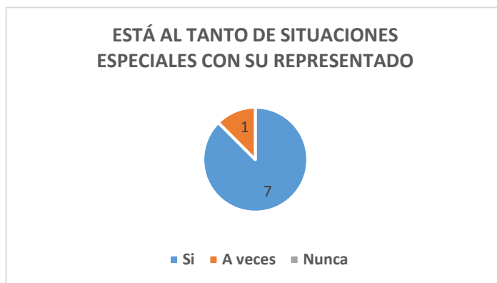
Gráfico No 6

Elaborado por: Silvia Rivera, Silvia Pineda y Miriam Gamboa.