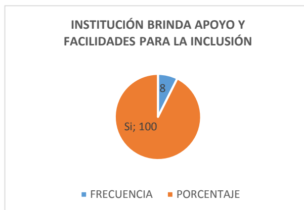
Gráfico No 4