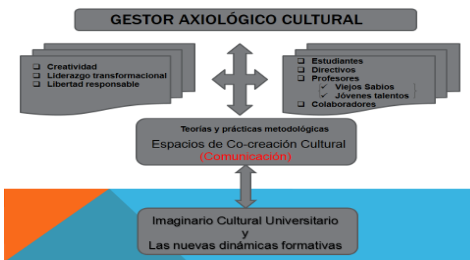
Fig. 1 Ámbitos universitarios de creación cultural

En este interés la construcción de una universidad diferente y potencialmente desarrolladora de lo humano y profesional en sus estudiantes, va acondicionar el reconocimiento de una modelación, que asuma la mirada que Ponce (2017) plantea sobre el ámbito institucional universitario en la formación de los profesionales como de gestores axiológicos culturales